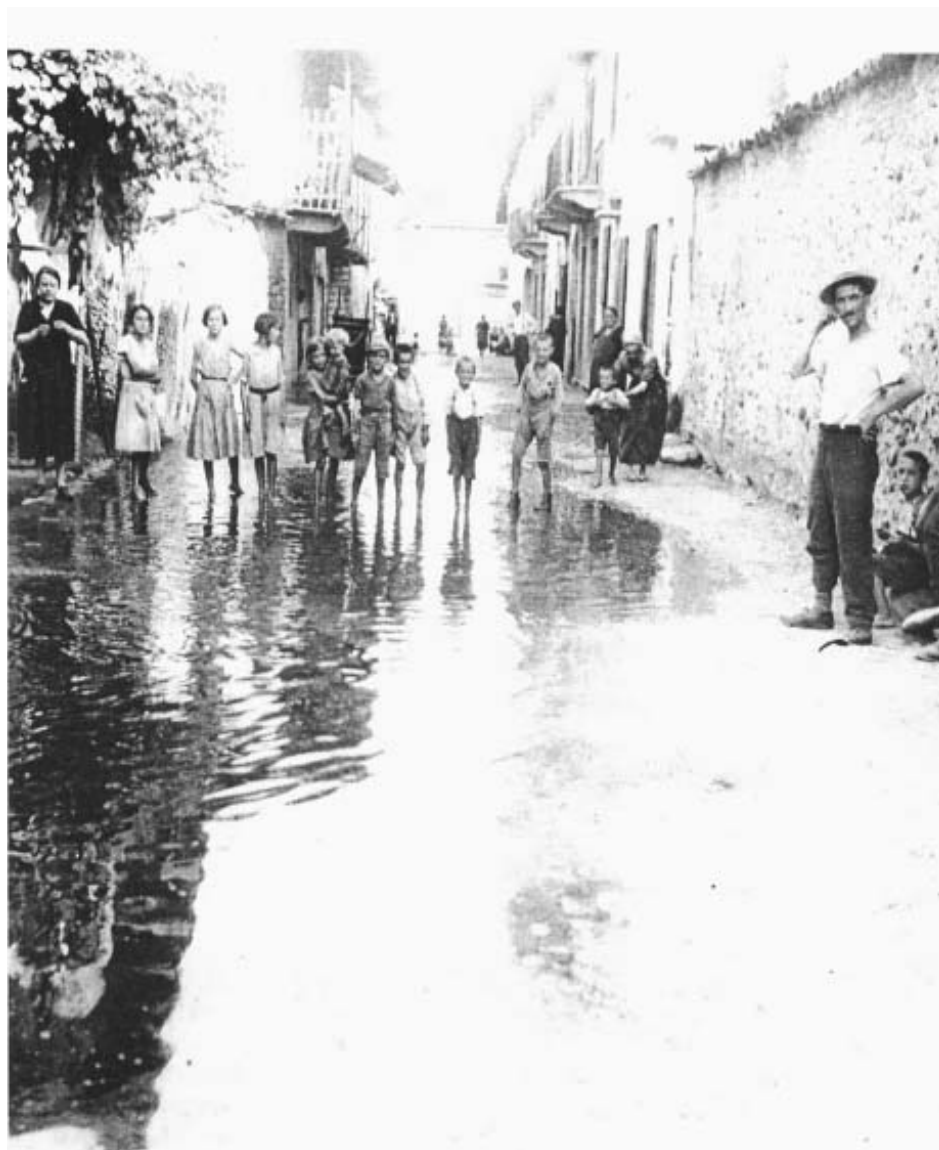
Via Villa allagata dopo la piena della Stura che ha provocato lo straripamento del canale e dei fossi che attraversano il paese nella primavera del 1934