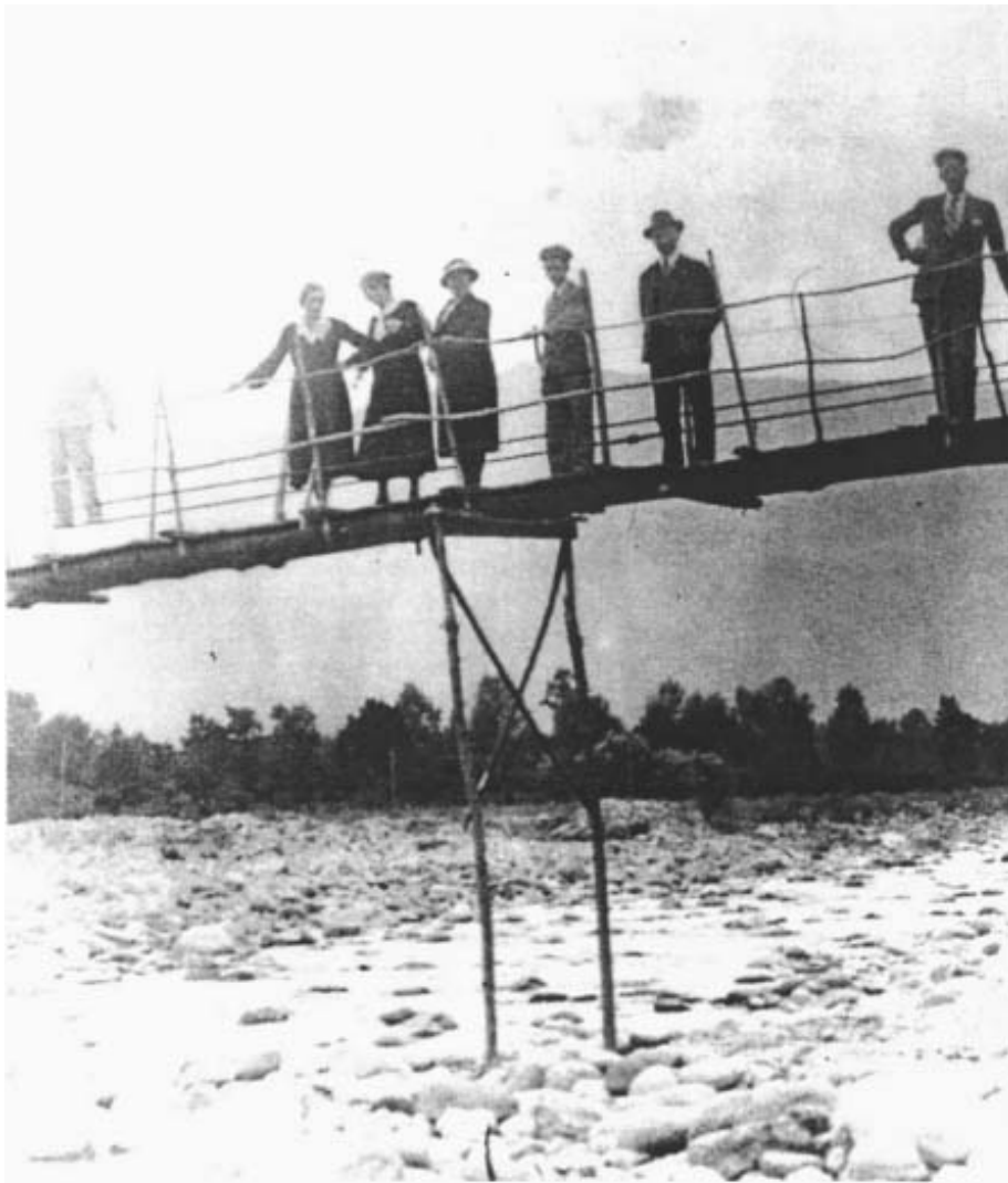
La pianca nell'anno 1932