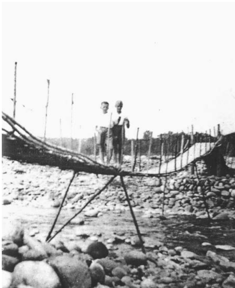
Due ragazzi attraversano la pianca negli anni '50