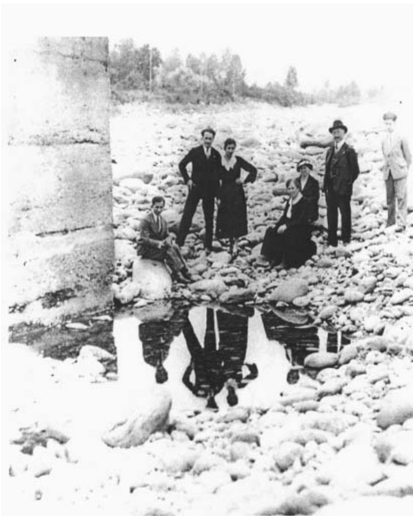
Foto ricordo accanto ad uno dei pilastri del vecchio ponte (Anno 1934)